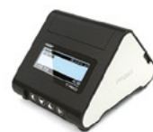
TRIO drukarka fiskalna