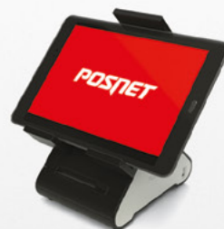
POS nowoczesny system sprzedaży