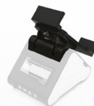
Uchwyt do tabletu lub smartfona (7' i 10')