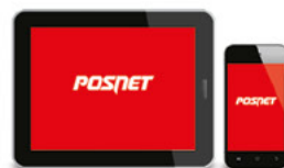
Urządzenie mobilne tablet/smartfon